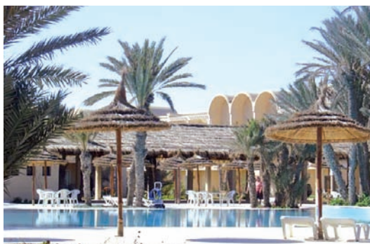
Bel Azur ***

known for its beautiful gardens from which the name Eden of Hammamet was given