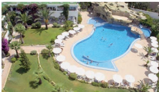
Sol Azur ****

with a congress palace ( I C C A conditions). A shopping Centre, a Casino.