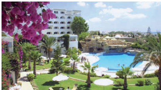
Royal Azur ****

with a Bio Azur thalasso Thalassotherapy centre (Winner of the A.F.J.E.T. thalaso) and a beauty Institute Nesri.